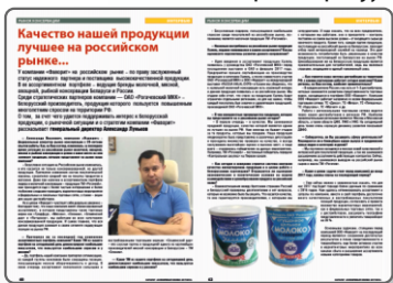
«Новинка года». ТМ «Рогачевъ»