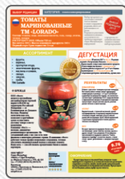
«Дегустация». Томаты маринованные ТМ «Lorado»