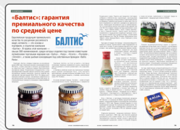
Статья «О компании». «Балтис»