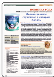
«Новинка». ТМ «Скатерь-Самобранка»