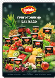
Полоса компании «Фест»