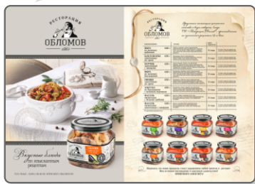
Разворот ТМ «Ресторация Обломов»