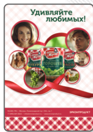
Полоса компании «Эрконпродукт»